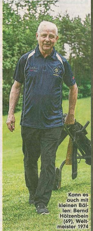
Kann es auch mit kleinen Bällen: Bernd Hötzenbein (67), Weltmeister 1974