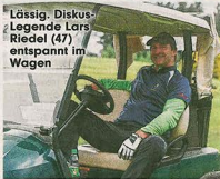
Lässig Diskus-Legende Lars Riedel (47) entspannt im Wagen